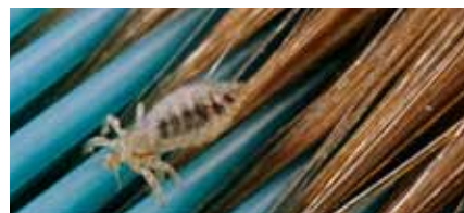
Hoofdluis op een kam.