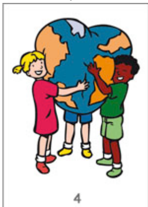
We hebben hart voor elkaar

Na de voorjaarsvakantie zijn we gestart met het nieuwe thema van de Vreedzame school. Tijdens de studiedag van 14 februari hebben wij als team ook weer scholing gehad over het werken met onze nieuwe methode. We zijn nog steeds erg blij met de keuze voor Vreedzaam. Het werken met de methode past goed bij hoe wij kijken naar de groepsprocessen en naar het "samen verantwoordelijk zijn". Ook het werken met de leerlingenraad past naadloos bij de democratische principes van de Vreedzame school. In de onderbouw krijgt u als ouder de kletskaarten van Vreedzaam. Hierop staan onderwerpen die in de groep aan bod komen en zo kunt u thuis het gesprek voeren met uw kind. Kletst u met ons mee?